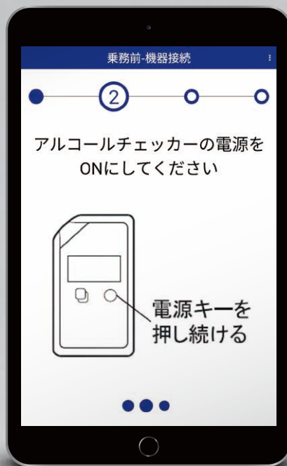
アルコール検知器協議会認定品

タブレット・スマートフォンにBluetoothペアリングでデータ管理 測る・見る + 通信機能のアルコール検知器